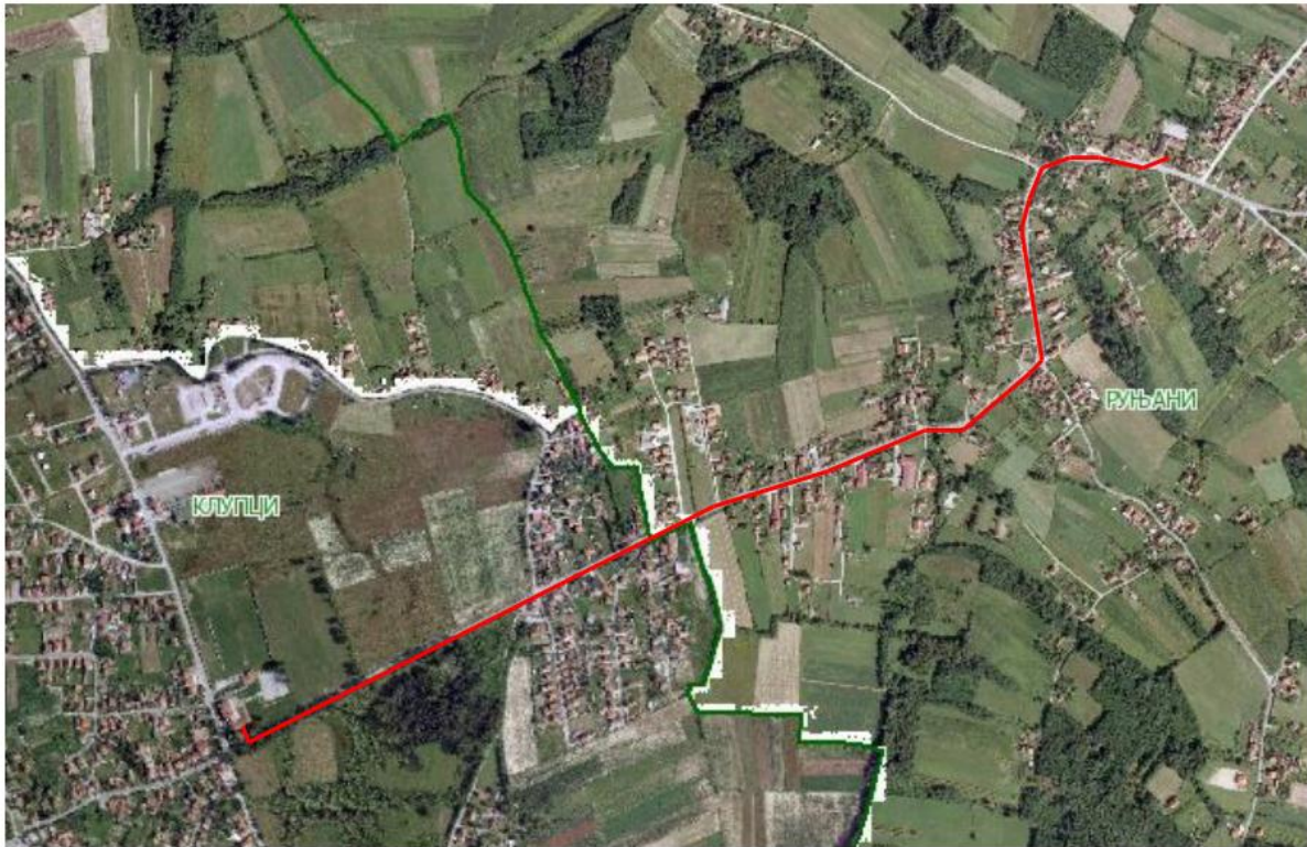
ОШ „ДОСИТЕЈ ОБРАДОВИЋ“ КЛУПЦИ – ИЗДВОЈЕНО ОДЕЉЕЊЕ РУЉАНИ (удаљеност 2,0 км)